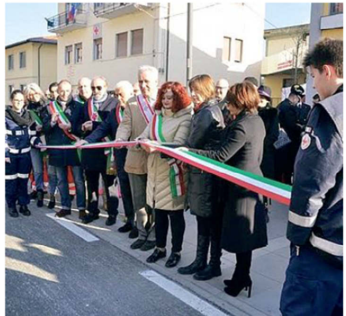
Festa a Incisa per l'inaugurazione della nuova piazza Auzzi

PRIMA del tradizionale taglio del nastro c'è stata anche la performance degli sbandieratori dei Borghi e Sestieri fiorentini, insomma una festa vera per tutti gli incisani che adesso aspettano la conclusione dell'intervento di ri-